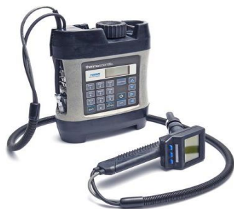
Figura 4-1: Instrumentos portátiles utilizados por los inspectores de South Coast AQMD en el campo

El personal de cumplimiento, tanto de South Coast AQMD y de CARB han acogido el uso de la tecnología como medio para realizar inspecciones más eficientes y efectivas. Los inspectores de South Coast AQMD tienen acceso a instrumentos avanzados para ayudarles a identificar problemas de contaminación del aire en tiempo real. Los instrumentos portátiles ilustrados a continuación están disponibles para los inspectores: