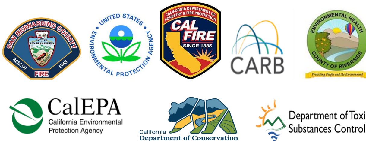
Figura 4-2: Ejemplos de agencias que colaboran rutinariamente con South Coast AQMD y CARB

CARB colabora con agencias locales para elaborar memorandos de entendimiento (MOUs por sus siglas en inglés), por ejemplo, un convenio con South Coast AQMD para hacer cumplir las normas de CARB sobre gases con efecto Invernadero en cierto tipo de instalaciones. Además, CARB ya está colaborando con el Departamento de Vehículos Motorizados de California (DMV) en un esfuerzo para la implementación de bloqueo de registro para los camiones y autobuses que no cumplan; colabora con la Patrulla de Caminos de California (CHP) para realizar inspecciones en los caminos y con otras agencias estatales y regionales para asegurarse que las agencias se están apoyando la una a la otra en sus esfuerzos de cumplimiento. Tanto South Coast AQMD como CARB tienen experiencia trabajando en una estrecha colaboración con otras agencias reglamentarias, ciudades y condados, agencias de salud pública y departamentos locales de policía y bomberos para llevar a cabo sus investigaciones y proporcionar información al público acerca de las fuentes locales de contaminación del aire.