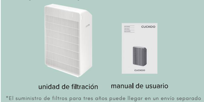
unidad de filtración